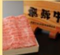
【飛騨牛】 養老ミート